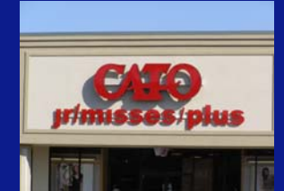
Anuncios de Pared o Fachada

Anuncios permitidos por el Departamento de Servicios de Desarrollo