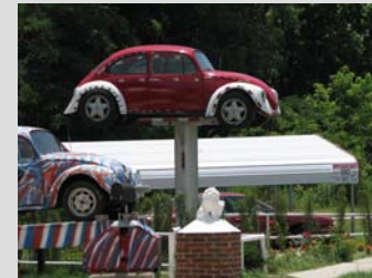
Anuncios tridimensionales o esculturas