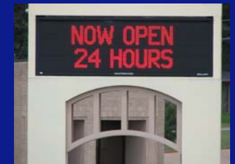
Anuncios de Centro de Mensaje Electrónico (EMC por sus siglas en inglés)