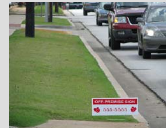
Letreros ilegalmente colocados en lugares de paso