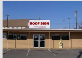
Anuncios colocados sobre techos