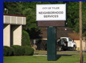
Anuncios en Monumentos y Anuncios sobre Pedestales