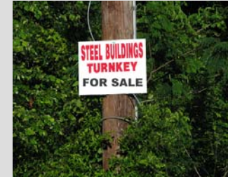
Letreros colocados en postes o árboles