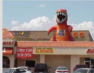
Anuncios inflables y Globos

Anuncios intermitentes, ondeantes, oscilantes, rotantes, o en movimiento